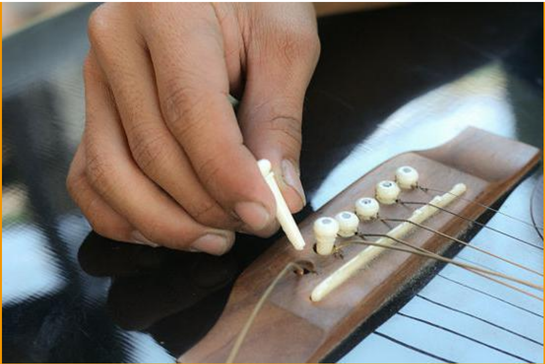
Пластмассовые колышки для крепления струн (Рис. 4)

Далее вставляем новую струну и начинаем накручивать. Обратите внимание, что при креплении струны сверху небольшой кончик (1 см) должен торчать. В процессе накручивания струны этот кончик спрячется под накрученной струной.